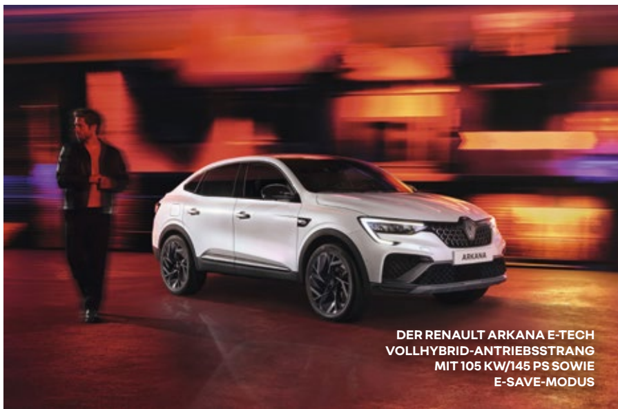
DER RENAULT ARKANA E-TECH VOLLHYBRID-ANTRIEBSSTRANG MIT 105 KW/145 PS SOWIE E-SAVE-MODUS

Der neue Clio ist in Österreich mit drei Motorisierungen erhältlich, so dass jede Kundin, jeder Kunde die Konfiguration so wählen kann, die am besten passt.